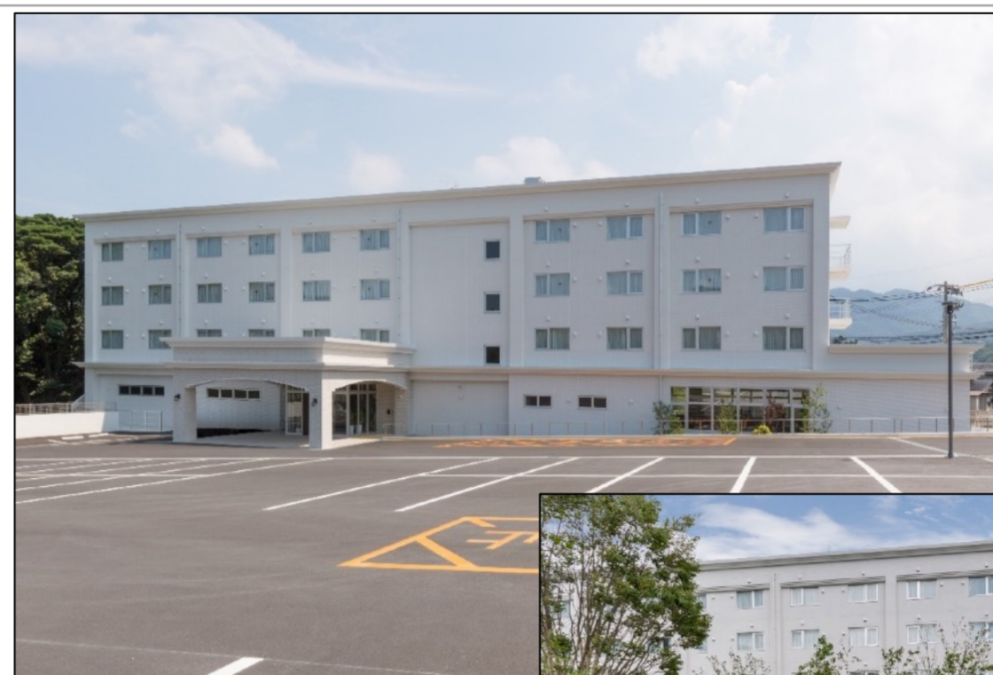
绿树成荫的明礬地区入口 占地面积6600㎡