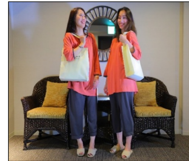
在房间内穿很舒服也可以在酒店内穿