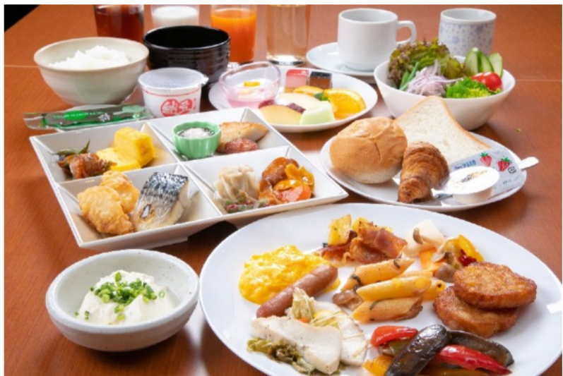
面向团体客人的晚餐方案