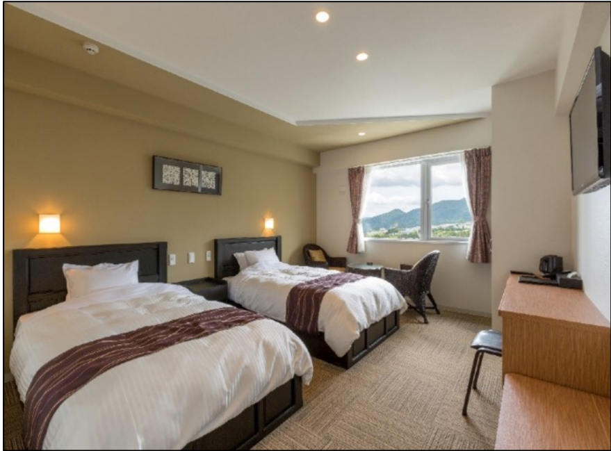
1200×2000的小双人床 所有房间都使用席梦思床垫