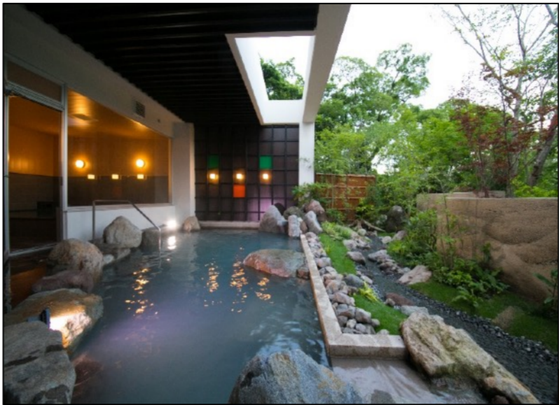
男女别露天温泉「照之湯」