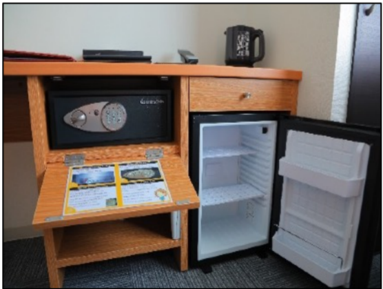
房间配有壁挂电视，加湿空气净化器，水壶，保险箱和冰箱。