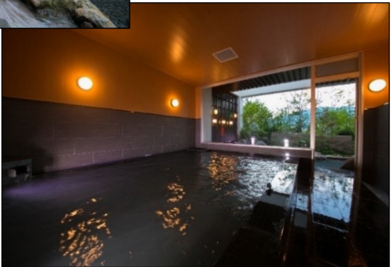
男女别室内温泉「照之湯」